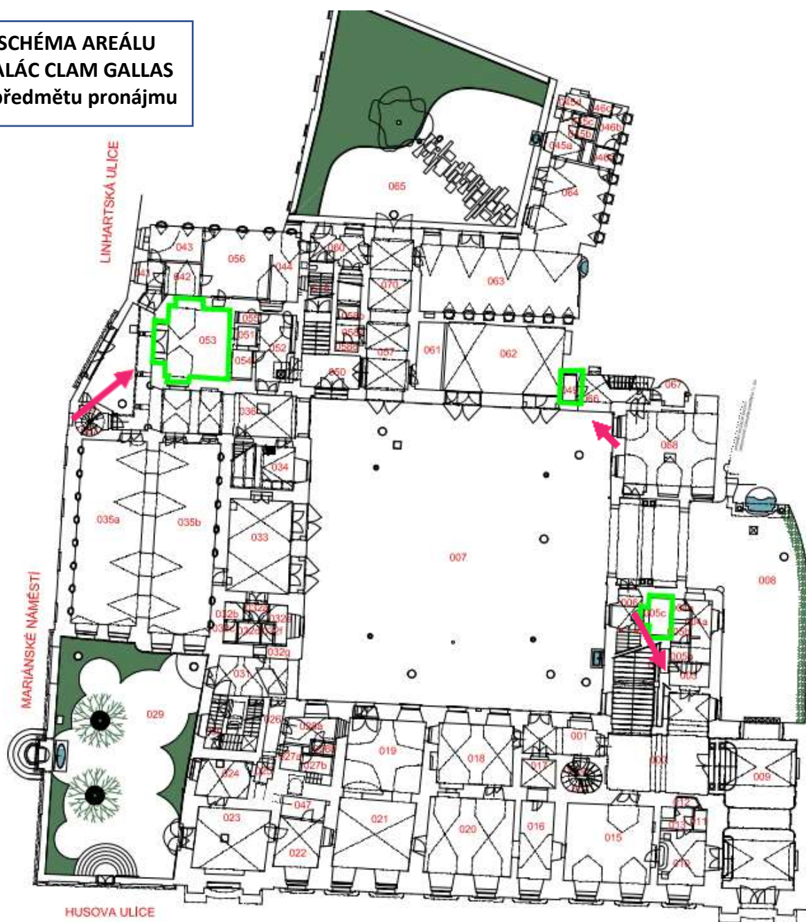
SCHÉMA AREÁLU PALÁC CLAM GALLAS a předmětu pronájmu

Prostory jsou přístupné z hlavního nádvoří paláce během jeho provozní doby.